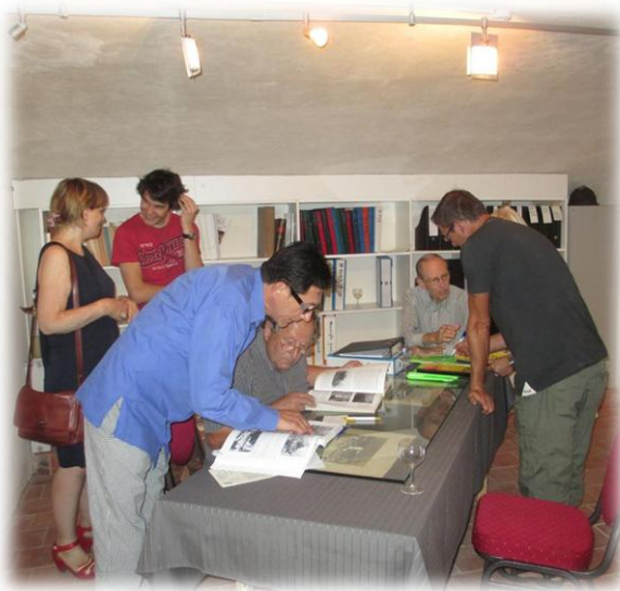
Sfeerbeeld van de eerste opendeurdag in onze Erfgoedkelder

Erfgoed Rausa is nu officieel een vzw en wij hebben ons definitief gevestigd in de Erfgoedkelder van GC het Koetshuis. Op de voorbije opendeurdag mochten we een flinke delegatie verwelkomen van het Liedekerks Heemkundig Genootschap. Onze vrienden hadden een prachtige attentie mee voor ons: een uitgebreid digitaal bestand met familiegegevens over de dorpen uit de omgeving, vrucht van veel opzoekwerk. Bezoekers van onze erfgoedkelder zullen er naar hartenlust kunnen in grasduinen.