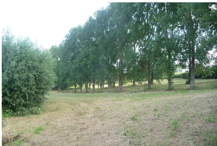
Zuidelijk deel van het Roosendael

In een van de volgende bijdragen zullen wij de toponiemen Roosendael, Boezenberg, Lommersberg, Hunselbeek, Elbeek en Hertveldt behandelen.