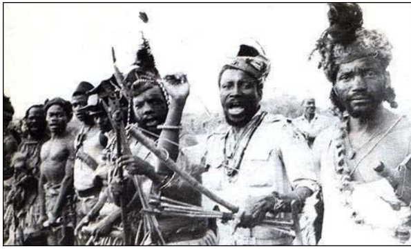
Een uitgelaten groep 'Simba's'

De opstand van de zogeheten Simba's ( Swahili voor 'leeuwen') in Oost-Kongo in de zomer van 1964 bleek onverwacht veel succes te hebben en het land werd verscheurd. Van uit het noorden rukte een leger van rebellen op, die teleurgesteld waren over de resultaten van de onafhankelijkheid. Ze vonden de regering te westers en zagen zichzelf eerder als socialisten. Althans volgens de officiële versie. Ze waren herkenbaar aan hun uitdagende helmen. Het waren mannen, vaak ook kinderen, in een roes van drank en drugs, mensen die niet echt een besef hadden van ideologieën, maar gewoon een hekel hadden aan alles wat blank was. Overal waar ze kwamen zouden ze blanken gijzelen.