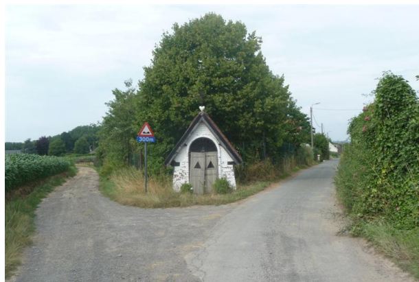
Hierboven: de kapel met links de 'Ios' van 't Roozendael, rechts de Molenkauter. Onderaan: de penibele toestand van de kapel.

Veruit de meeste waren gewijd aan Onze Lieve Vrouw, die duidelijk de populairste heilige was als troosteres der verdrukten en als gids naar haar geliefde zoon. In Roosdaal alleen zijn er minstens zeven kapellen ter verering van Onze Lieve Vrouw van Zeven Weeën.