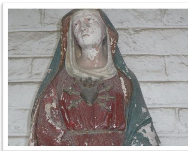
Beeld van het met zwaarden doorboorde hart van Onze lieve Vrouw van zeven Weeën in de kapel aan de Molenkauter

De oudste confrérie van zusters toegewijd aan Maria van Smarten in Ruiselede vierde in 2005 zijn zeventhonderdjarig bestaan. Het symbool van Maria van zeven Weeën is tweëerlei. Op de top van de imposante kapel zien wij het hart doorboord door het kruis, wat het lijden van Maria om haar zoon symboliseert. Op het beeld in de kapel zien wij Maria met haar hart doorboord door zeven zwaarden, de zeven Weeën. Zij draagt het lijden van de mensheid van geboorte tot dood.